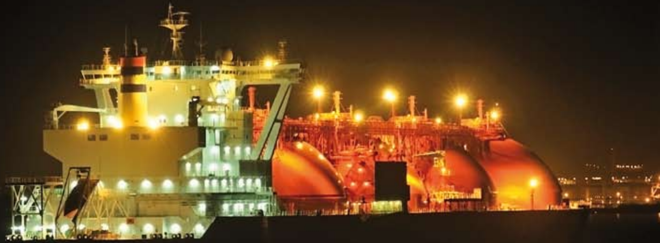
Foto: LNG- Tankschiff